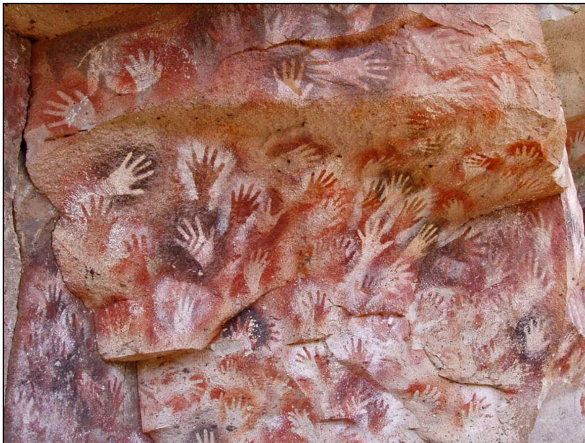
Cueva de las Manos Pcia. Santa Cruz, Argentina

“Nunca vaciles en tender la mano; nunca titubées en aceptar la mano que otro te tiende”. Juan XXIII