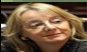
Lic. Alicia Kirchner Senadora de la Nación Argentina ex-Ministro Desarrollo Social

Master en Dirección de Organizaciones con Fines Sociales